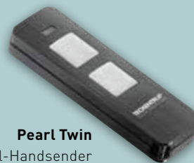
Pearl Twin 2-Befehl-Handsender

Enorm effizient: Energiesparend durch bis zu <1 Watt Verbrauch im Standby-Modus (modellabhängig)